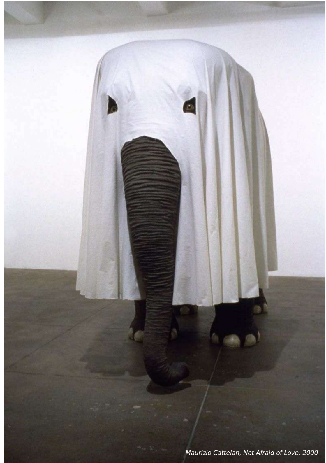
Maurizio Cattelan, Not Afraid of Love , 2000

Dans le second mouvement, l'harmonie est parfois touchée du doigt mais sans avoir été recherchée, presque sans effort, dans des moments de clarté fortuits. S'exprime