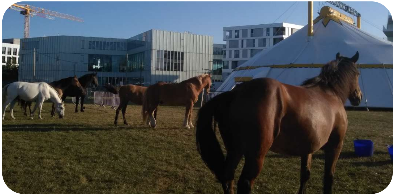
Campement à Antony