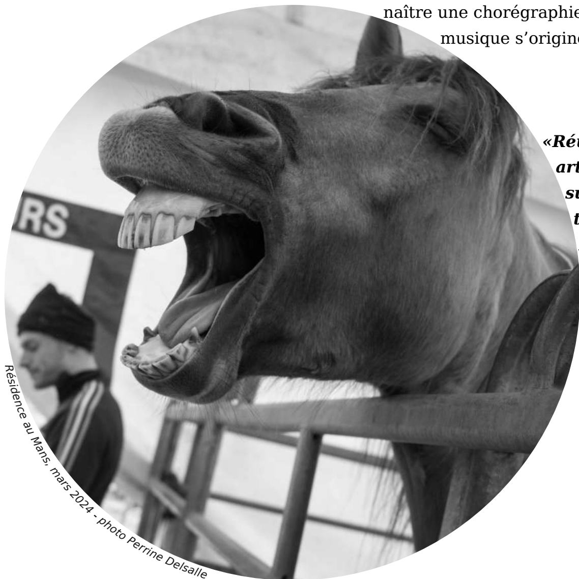
Résidence au Mans, mars 2024